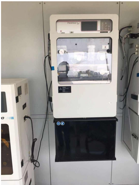
废水总排口-氨氮在线