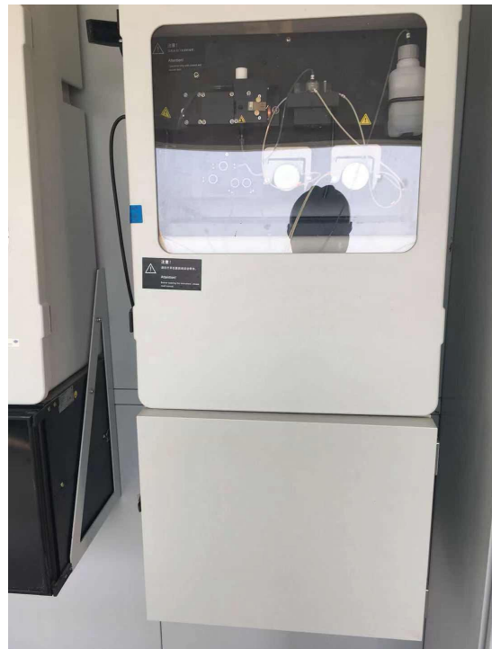
废水总排口-总氮在线