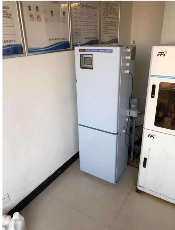
废水总排口-总磷在线