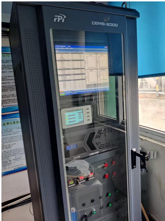
6#RTO 焚烧炉系统在线 CEMS